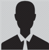
Documento de ejemplo

Seleccionar los documentos que desee cargar al sistema