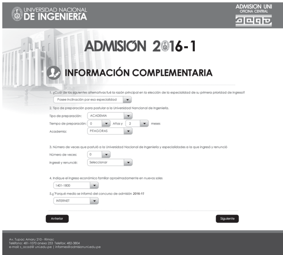
Figura 8. INFORMACIÓN COMPLEMENTARIA