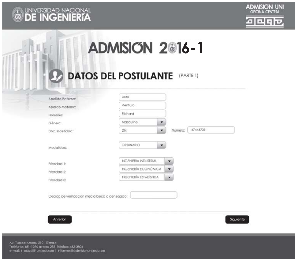
Figura 4. DATOS DEL POSTULANTE (Parte 1)