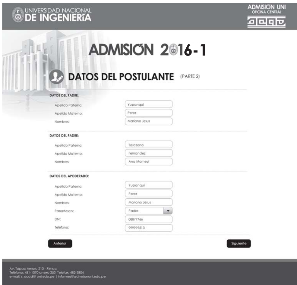
Figura 5. DATOS DEL POSTULANTE (Parte 2)