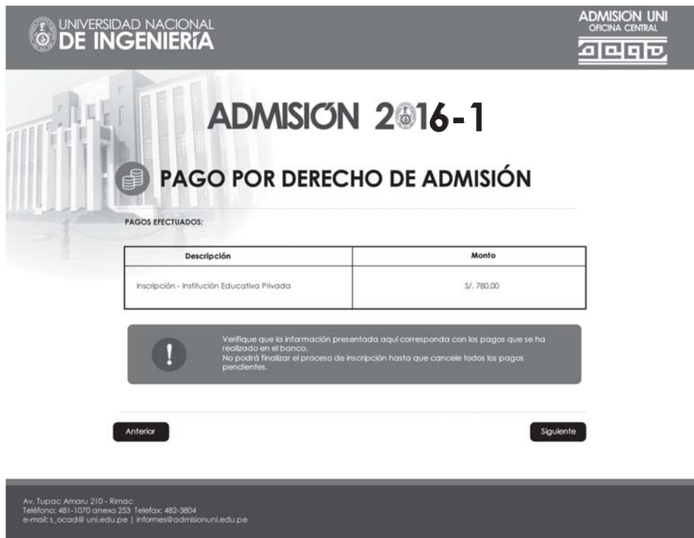
Figura 9. PAGOS POR DERECHO DE ADMISIÓN

El sistema le mostrará los pagos efectuados por los conceptos aplicables al Concurso de Admisión. Verifique que la información presentada corresponda a los pagos que ha realizado en el banco.