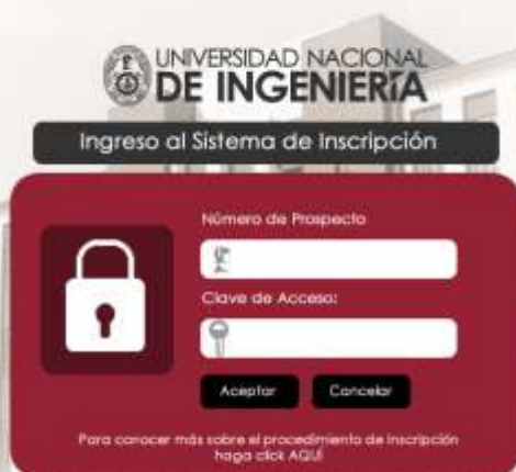
Figura 1. INGRESO AL SISTEMA DE INSCRIPCIÓN

El Número de Carpeta y la Clave de Acceso se encuentran adheridos al Prospecto de Admisión.