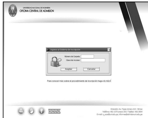
Figura 1. INGRESO AL SISTEMA DE INSCRIPCIÓN

El Número de Prospecto y la Clave de Acceso se encuentran impresas en el Prospecto de Admisión.